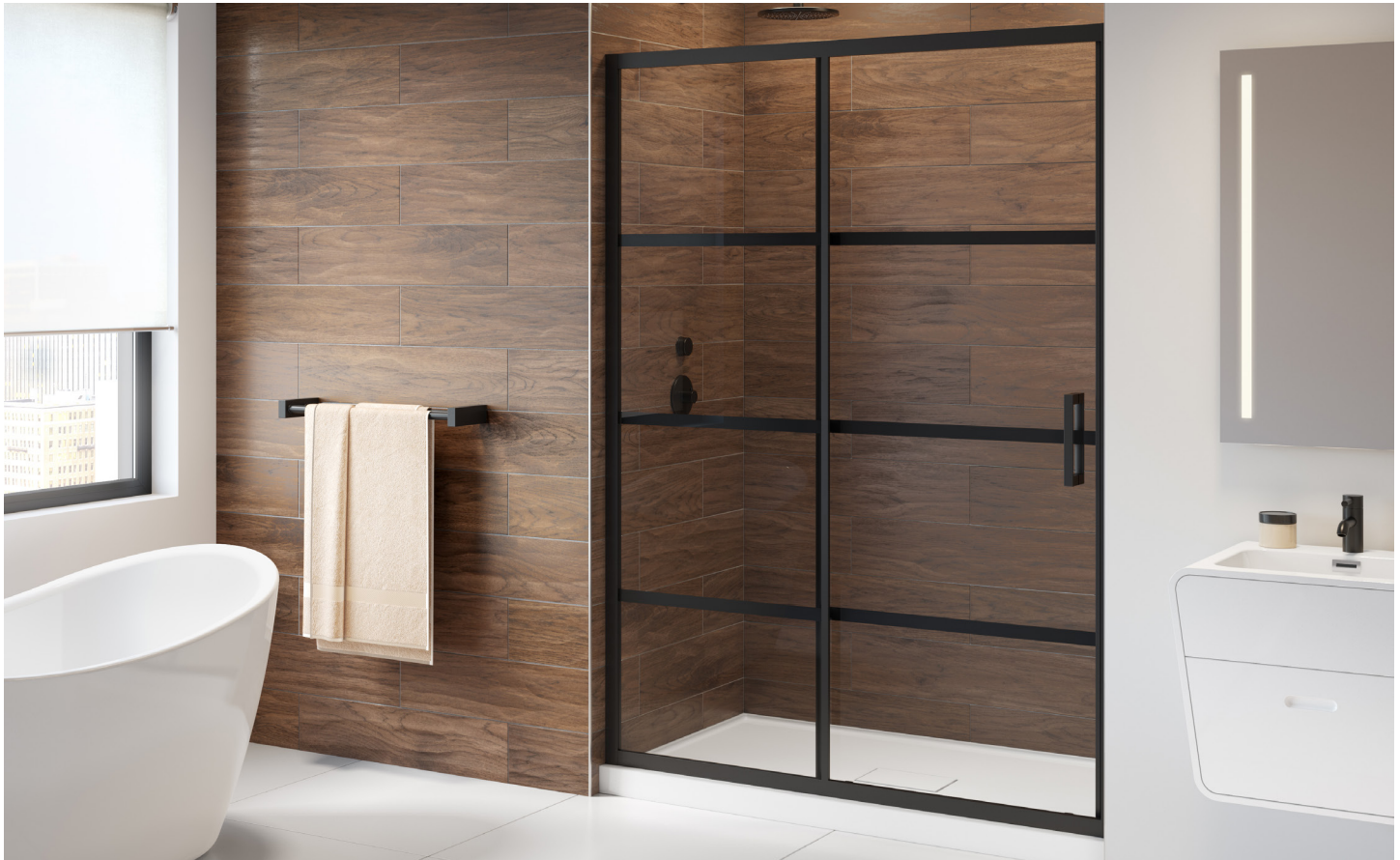
Model shown / Modèle présenté :LA60-33-43-79